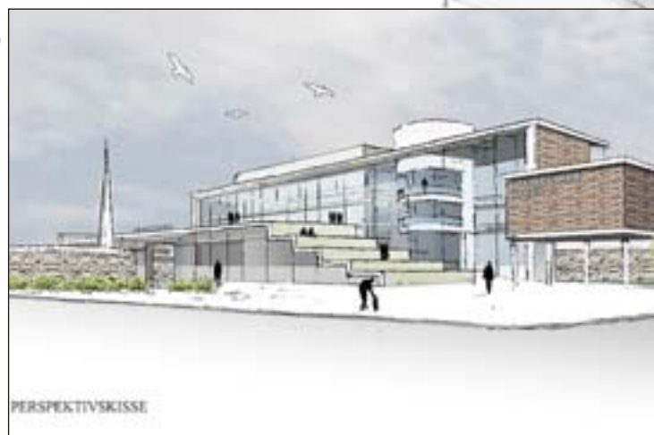
SAMFUNNSHUS: Slik ser arkitekten for seg det nye «samfunnshuset» slik det blir over gateplan. (Ill.: Arkitekt Hans Petter Madsø)

– Men mange brikker må på plass, og vi er innstilt på at dette må ta den tiden som det må, og der alt skal foregå både åpent og rett, sier han.