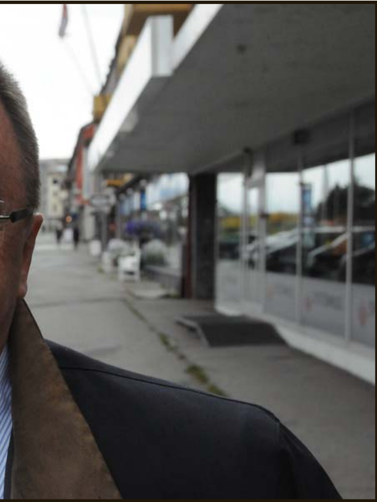
litiske verv, etter at han nå takket til toppsjefjobben i ForteNarvik.